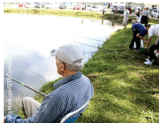
15 de agosto - Pesca Bancária, na Sede Campestre.