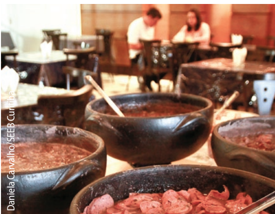
08 de agosto - Feijoada dos Bancários, na Sede Campestre.