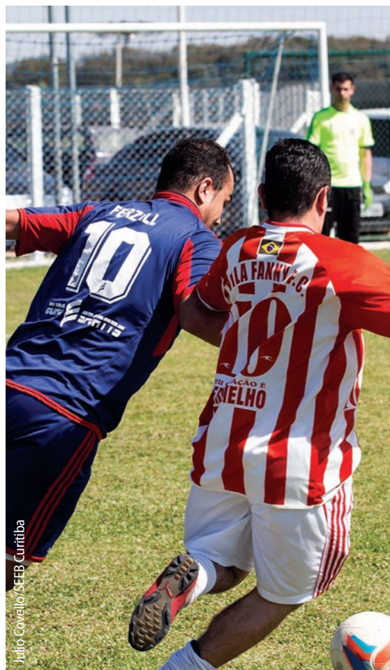
01 de agosto - Início da Copa Bancária de Futebol Masculino 2015, na Sede Campestre.