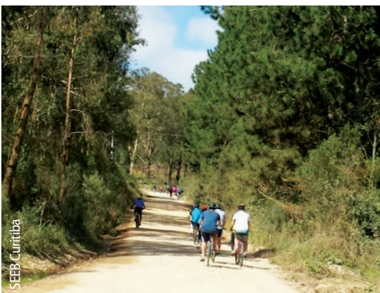
22 de agosto - Cicloturismo dos Bancários, no Assentamento Contestado (Lapa).