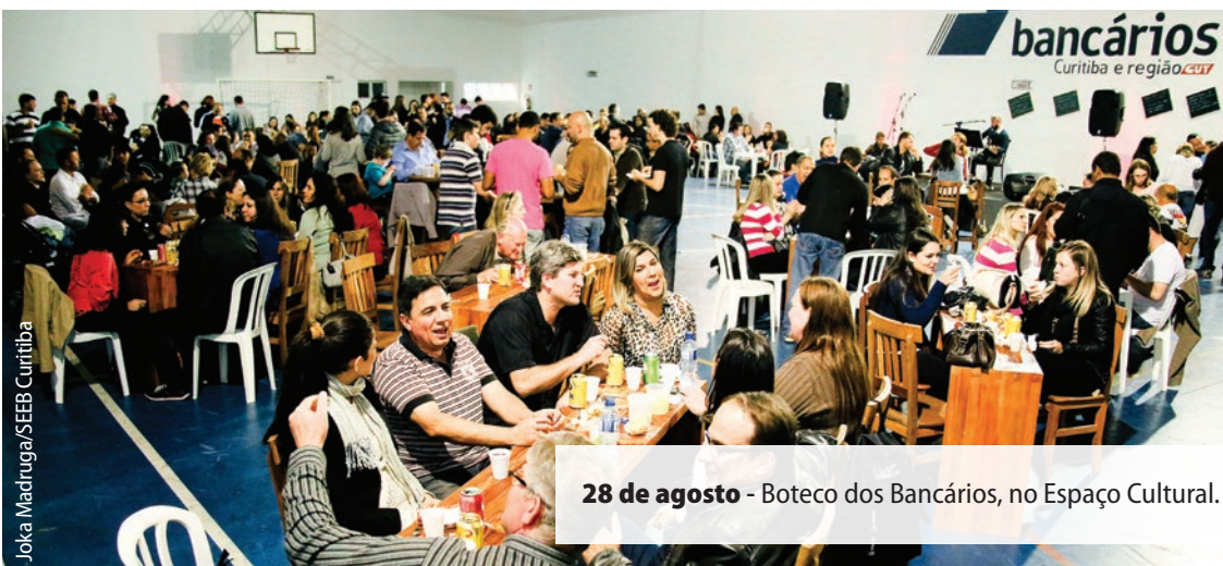
28 de agosto - Boteco dos Bancários, no Espaço Cultural.