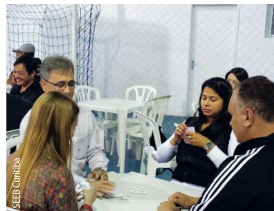
29 de agosto - 1º Torneio de Truco, no Espaço Cultural.