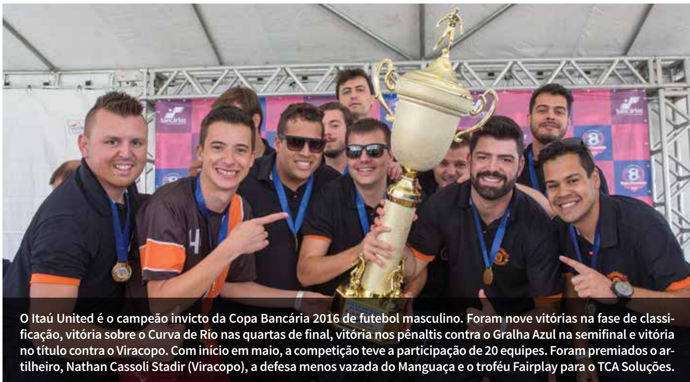
/JULIO COVELLO/SEEB CURITIBA

O Itaú United é o campeão invicto da Copa Bancária 2016 de futebol masculino. Foram nove vitórias na fase de classificação, vitória sobre o Curva de Rio nas quartas de final, vitória nos pênaltis contra o Gralha Azul na semifinal e vitória no título contra o Viracopo. Com início em maio, a competição teve a participação de 20 equipes. Foram premiados o artilheiro, Nathan Cassoli Stadir (Viracopo), a defesa menos vazada do Manguaça e o troféu Fairplay para o TCA Soluções.